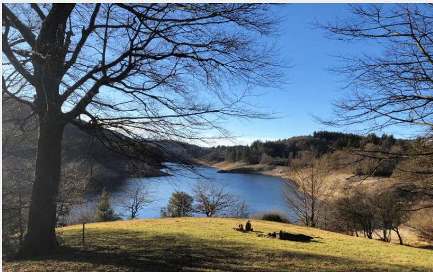
Le lac des Saints-Peyres