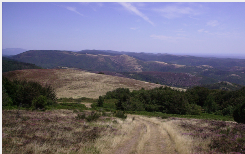
Plateau de Sales